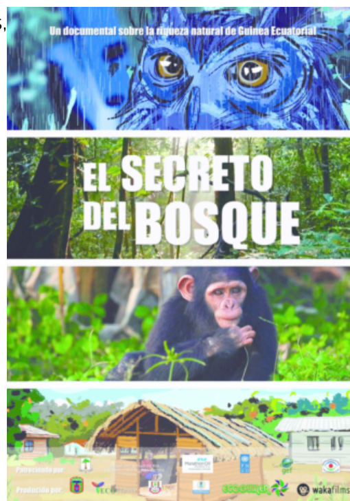
"El secreto del bosque", de Antonio Grunfeld Rius.

Como entretenimiento, como material didáctico o como herramienta de divulgación, el cine científico está demostrando ser un medio poderoso para comunicarse con el público amplio. Es necesario considerar entonces el incremento del uso de esta forma de expresión para crear públicos exigentes de trabajos de calidad, tanto en los contenidos como en la obra audiovisual generada. Este público podrá entonces no sólo adquirir directamente conocimientos científicos, sino comprender el quehacer de los científicos, sus métodos y motivaciones. C 2