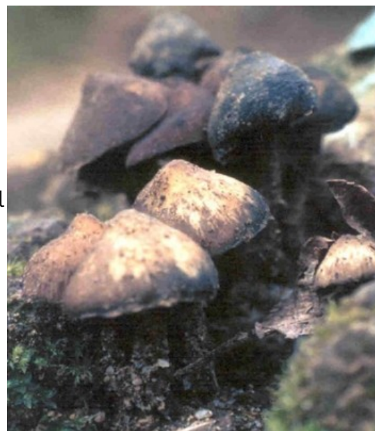
Fig. 1. El hongo sagrado Psilocybe zapotecorum , común en las regiones oaxaqueñas, conocido como derrumbe o "corona de cristo."

(Schultes 1938), en donde se les identificó erróneamente en el género Panaeolus (fig. 2). Esto debido a una mala interpretación que se hizo del hongo de Sahagún. Todas las especies de Panaeolus son tóxicas y ninguna es usada por indígenas mexicanos. Fueron Reko y Weitlaner, dos antropólogos austriacos que trataron de identificar el "teonanácatl" de Sahagún, los que le comunicaron a Schultes, que el hongo sagrado era Panaeolus . Ello porque los hongos de Reko y Weitlaner fueron enviados a los E.U.A. y allá se identificaron como Panaeolus (Reko, 1945)