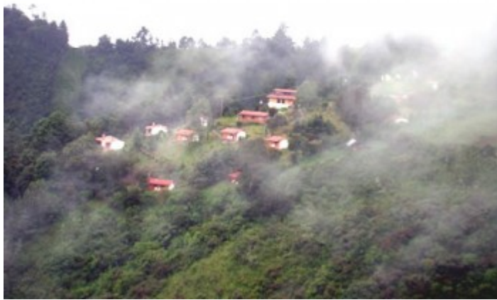
San José del Pacífico, Oaxaca.

Europeos, se ha perdido su uso tradicional, aunque existen piezas antropológicas, grabados o pinturas rupestres que demuestran el uso tradicional de los hongos alucinógenos en Europa. Incluso en México, el uso tradicional de los hongos alucinógenos se está perdiendo con el avance de la civilización moderna. Los "hongos sagrados" como se nombran a estos hongos entre los indígenas, se usan por curanderos principalmente en la región de Huautla de Jiménez, Oaxaca.