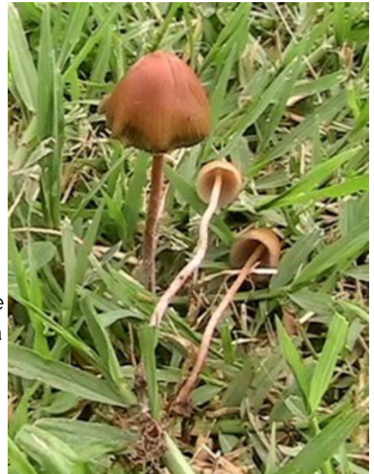
Fig. 3. Psilocybe mexicana , el "pajarito" de Huautla de Jiménez, hongo alucinógeno el cual es muy parecido al Panaeolus . Obsérvense las diferencias en el color.