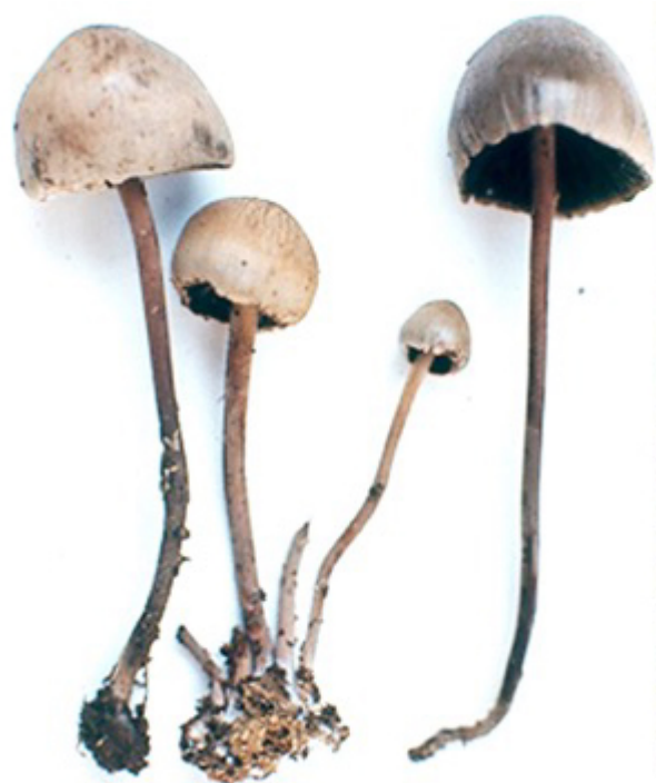
Fig. 2 Panaeolus sphinctrinus , hongo tóxico que mal se identificó como el "teonanácatl" de Sahagún.

Los mazatecos y los zapotecos llaman a estos hongos de muchas maneras, según la especie a la que refiera. Los "derrumbes" o "desbarrancaderos" son los que crecen en los derrumbes lodosos, que son conocidos científicamente como Psilocybe zapotecorum (fig. 1). A todos estos hongos los denominan "hongos sagrados" o divinos". Científicamente estos hongos alucinógenos se adscriben al género Psilocybe , del cual se conoce más de 100 especies. Aquí existe otra confusión, debido a que el primer artículo científico que se publicó sobre los hongos de Huautla de Jiménez, fue en la Universidad de Harvard