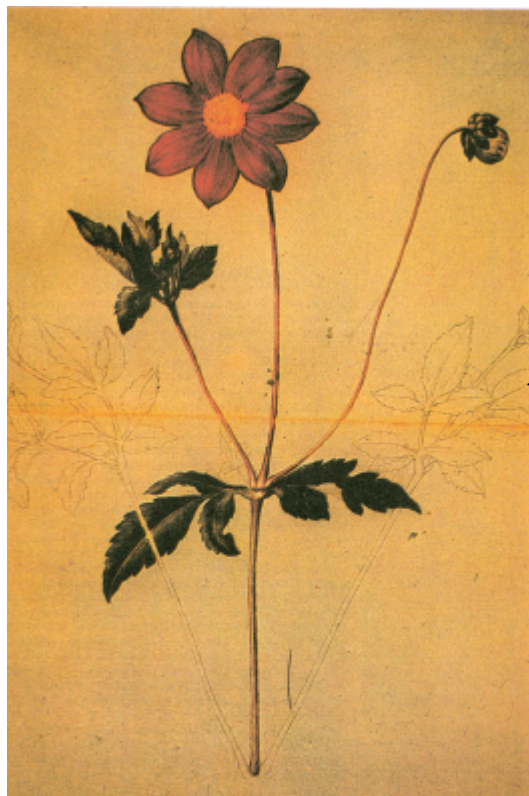
Ejemplares de flora mexicana de Sesé y Mociño

Debido a estos nombramientos y por su amistad con médicos franceses, Moziño fue arrestado por los patriotas españoles como traidor cuando los franceses se retiraron de España. En 1812 abandonó la Península, llevando consigo sus manuscritos y dibujos; encontró refugio en Montpellier, donde el botánico suizo Augustin-Pyramus De Candolle reconoció el valor de sus dibujos de plantas y animales. En 1916 Moziño rehusó la oferta de De Candolle de acompañarlo a Génova para clasificar el trabajo juntos: "estoy muy viejo y enfermo; soy muy desafortunado; llévalos a Génova contigo; son tuyos, y en ti confío su cuidado y mi gloria futura."