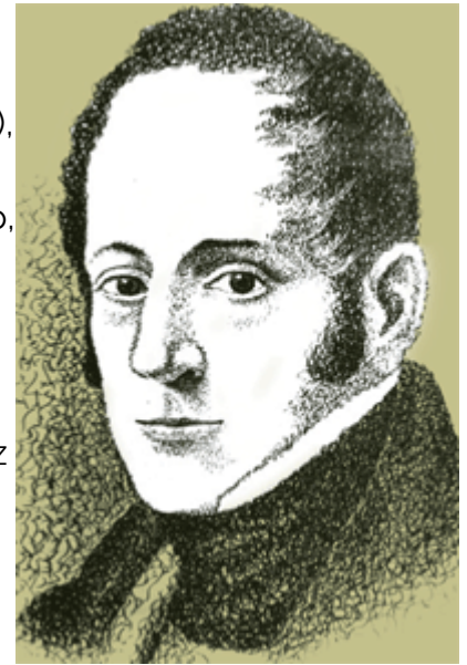
José Mariano Moziño fue el primer científico importante en estudiar la Columbia Británica.

Aunque probablemente Moziño exageró su habilidad para aprender el idioma en cuestión de meses, su inmersión en la cultura Nuu-chah-nulth fue de gran ayuda para las negociaciones de los españoles con el jefe Maquinna durante la crisis de Nutka; en la que, alrededor de 1790, ingleses y españoles arreglaron su disputa sobre la posesión de esas tierras.