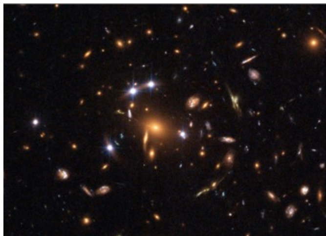
Figura 4. Quásar, lentes gravitacionales. SDSS

La relatividad general es un marco en que nos aparece un concepto de valor explicativo muy interesante, el de lente gravitacional.