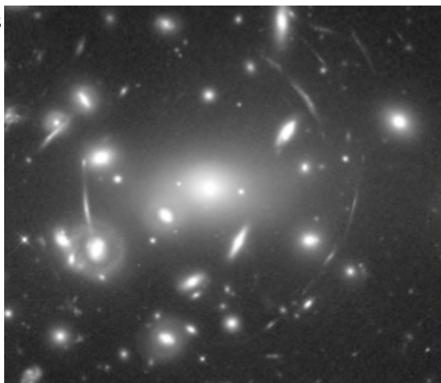
Figura 3. Anillos gravitacionales de Einstein.

No obstante debemos considerar que quizá este conocimiento cada más perfeccionado, que irá permitiendo discernir las percepciones correctas de las incorrectas, signifique cambiar algunas de las interpretaciones más arraigadas de la física.