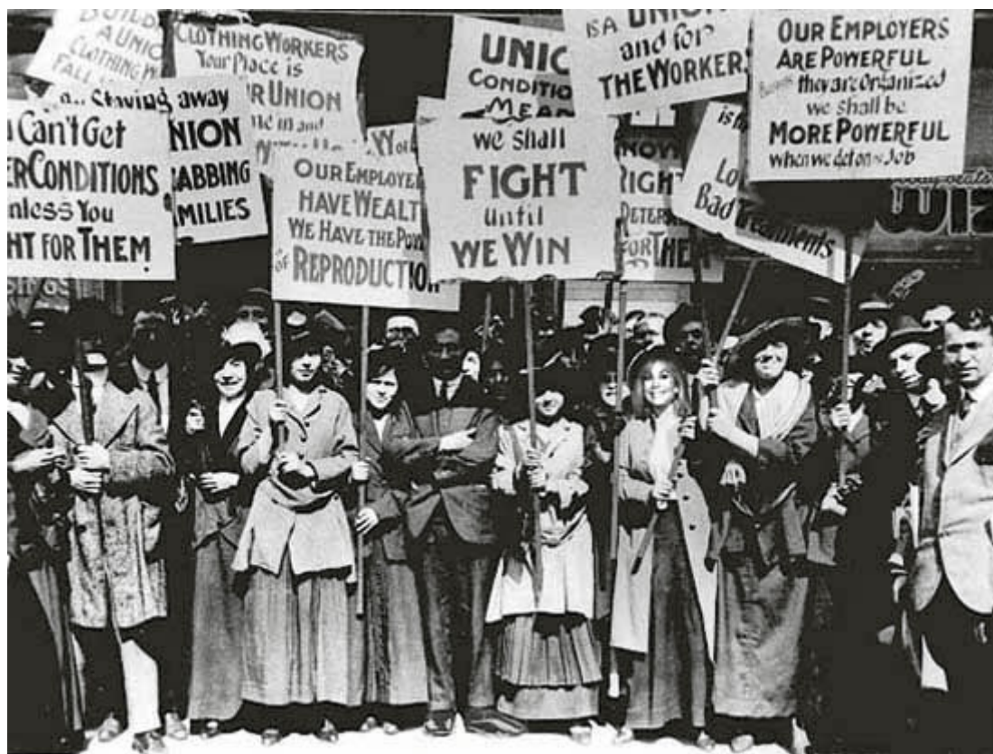
Trabajadoras de la empresa Cotton en la huelga de 1908.

Se han hecho visibles los mecanismos mediante los cuales las estructuras sedentarias de los poderes políticos, en particular, las fuerzas neoliberales, obstruyen aún más las políticas avanzadas que permiten la diversidad de género. En efecto, a medida que las mujeres entran en espacios de igualdad, lo hacen a lo largo de divisiones jerárquicas que hacen retroceder estas pluralidades en evolución, propagando lo que es ganancia realmente ideológica versus progreso feminista sostenible.