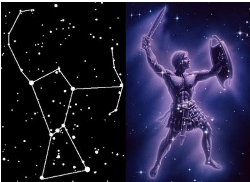
Constelación de Orión

Las constelaciones llamadas zodiacales son especiales. Suponiendo a la tierra como el centro, el sol describe en el cielo una trayectoria que llamamos Eclíptica. La luna y los planetas siempre pasan muy cerca de ella. Desde la antigua Babilonia se decidió dividir la Eclíptica en 12 partes. A cada una se le asignó una constelación, que llamamos signos zodiacales. Algunas de las constelaciones y sus nombres viene de la época babilónica como son Tauro, Leo, Escorpión, Capricornio, Geminis y Cáncer. Pero, ¿qué quiere decir nacer bajo un signo del zodiaco? Si nacieron bajo el signo de Leo quiere decir que cuando se mete el sol, la constelación que se ocultará después del sol es Leo.