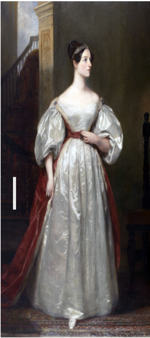
Figura 2 Retrato de Ada Lovelace, Margaret Sarah Carpenter 1836. Government Art Collection.

Para ir a sus orígenes, es necesario conocer de cerca a una mujer de intelecto vivaz, apasionada de las matemáticas y de la mecánica, que nació, vivió y murió en Inglaterra en el siglo XIX: Ada Byron condesa de Lovelace. Durante su corta vida, Ada fue capaz de dejar testimonio de algunas intuiciones importantes que proporcionaron mucho tiempo después los fundamentos de la informática.