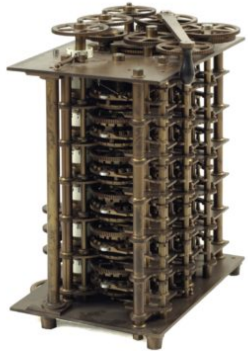
Figura 3 Modelo de Máquina Diferencial de Babbage, Museo Nazionale della Scienza e della Tecnologia "Leonardo da Vinci" di Milano.