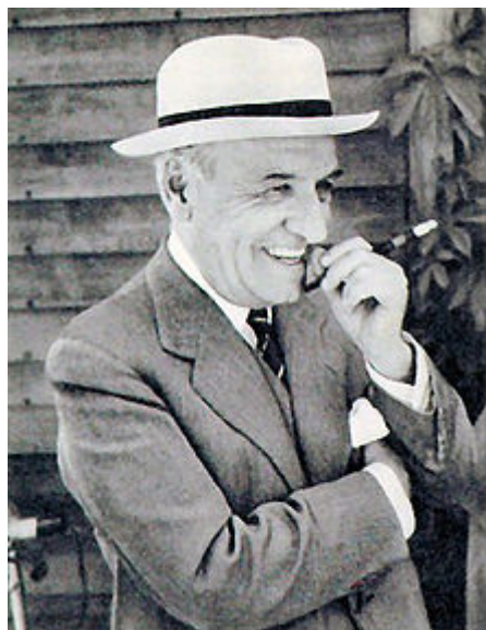
Ortega y Gasset

Esa pretensión de condenar a todo acusado es un claro ejemplo de lo que hacen los buenos hombres cuando tienen poder, negar los derechos ajenos y pisar a los demás. En definitiva, los buenos hombres no se diferencian en nada de los que llaman malos ; y será debido a que todos ellos forman parte de la especie humana y, en cambio, los conceptos sociales son interpretaciones realizadas por los poderosos.