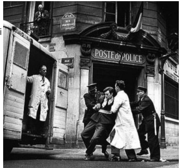
El experimento de Rosenhan

Los sabios no creían el relato de la señora Collins porque pensaban que la sociedad es perfecta y que no pueden tener lugar en ella hechos de esa naturaleza. Como sabemos que los hechos relatados eran ciertos, lo que se ve es la fantasía en la que viven los sabios, tan ajenos a la verdad que realmente son ellos quienes tienen una visión alterada de mundo y no las personas de cuyos