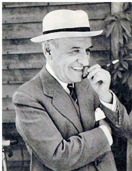
Ortega y Gasset

Esa pretensión de condenar a todo acusado es un claro ejemplo de lo que hacen los buenos hombres cuando tienen poder, negar los derechos ajenos y pisar a los demás. En definitiva, los buenos hombres no se diferencian en nada de los que llaman malos ; y será debido a que todos ellos forman parte de la especie humana y, en cambio, los conceptos sociales son interpretaciones realizadas por los poderosos.