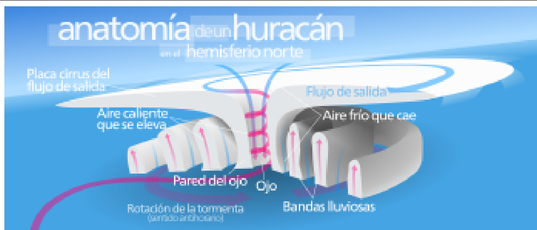
Anatomía de un huracán en el hemisferio norte

Si el ciclón se mueve el tiempo suficiente por regiones con aguas calientes, y en las capas superiores de éste no hay corrientes intensas que corten las corrientes convectivas, la presión continuará descendiendo, y la velocidad de los vientos aumentando. De esta manera el organismo ciclónico comenzará a transitar por las distintas categorías en las que se ha dividido su evolución.