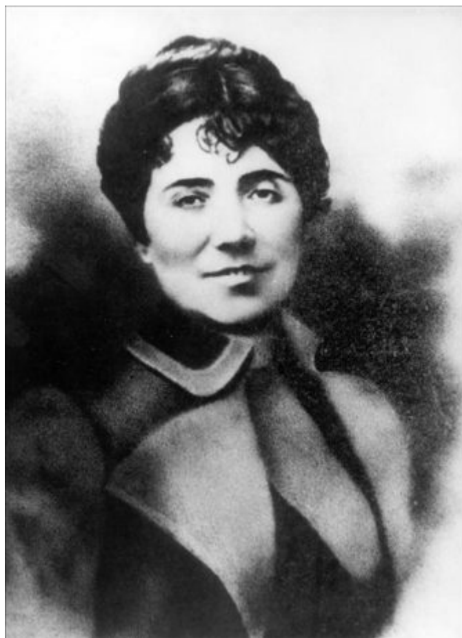
Retrato de la escritora gallega Rosalía de Castro.