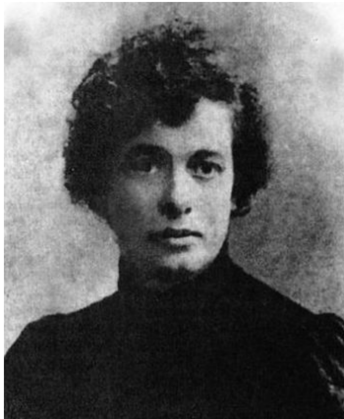
Adela Zamudio a principios del siglo XX.