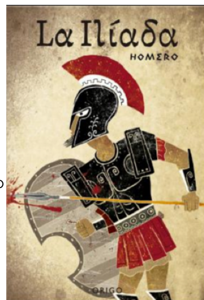
Figura 3. La Ilíada epopeya atribuida a Homero (aprox. S. VIII a.C.)