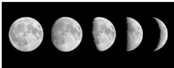
Fases de la Luna

La Luna y la Tierra forman un sistema planetario muy singular, debido, por una parte, al gran tamaño del satélite y por otra, a su proximidad a la Tierra, que a su vez orbita alrededor del Sol.