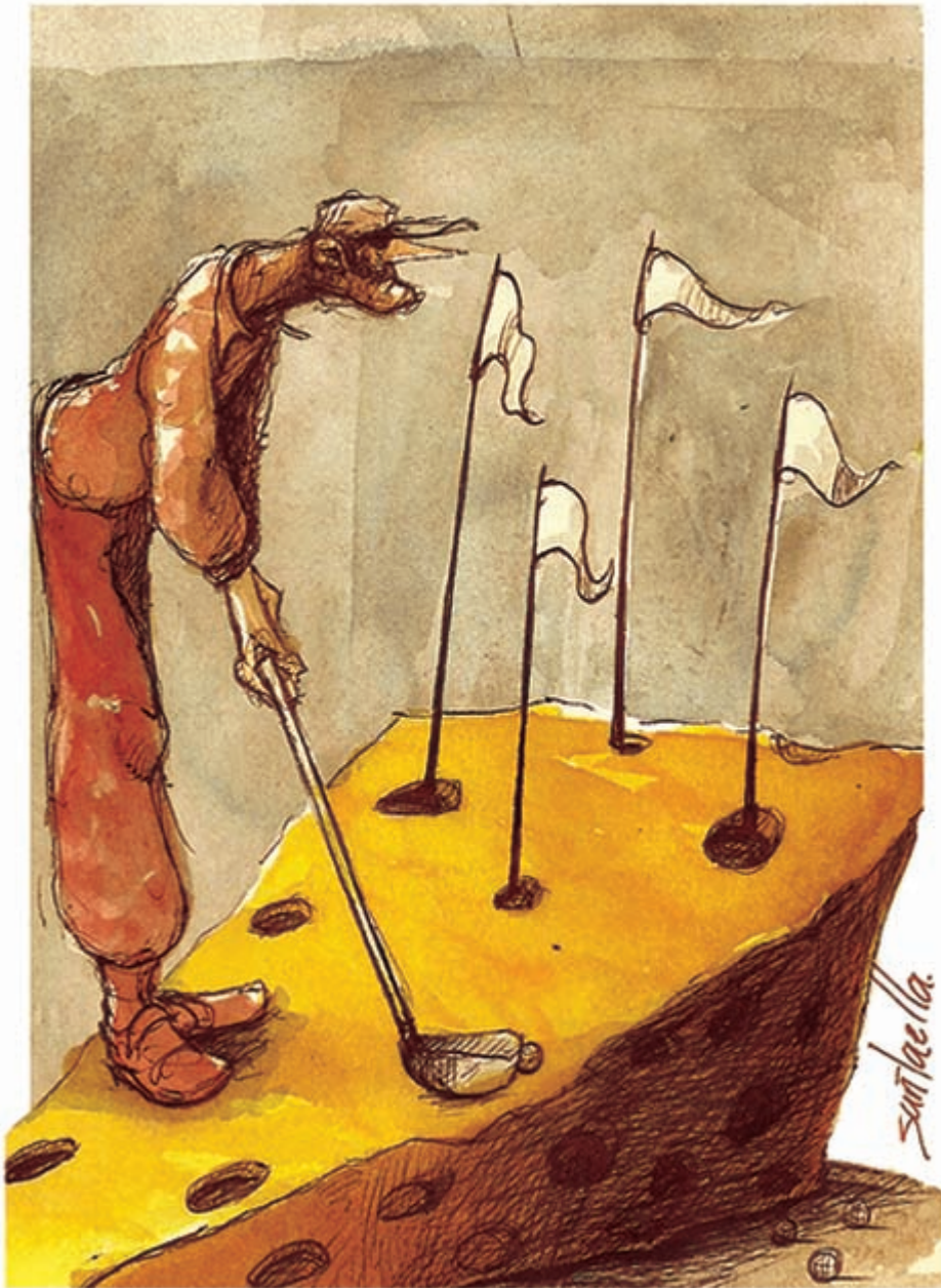
Festival del humor internacional ( el queso)