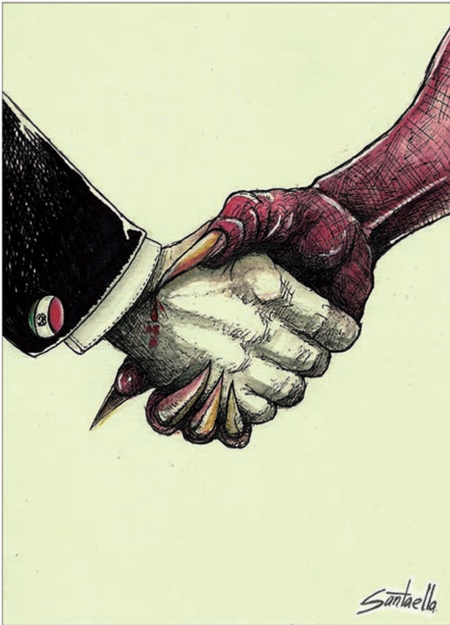
Pacto por México