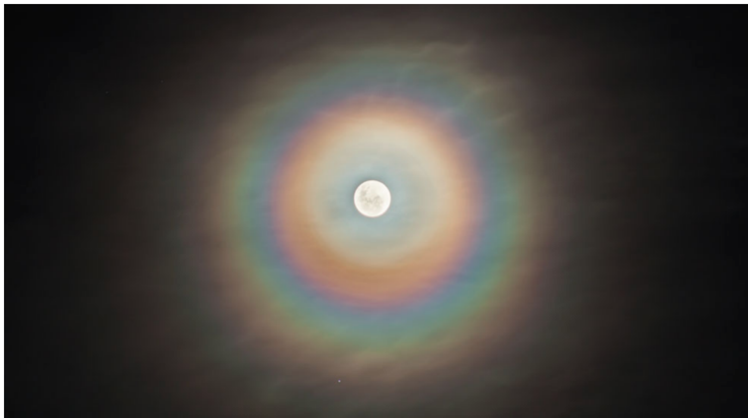
Figura 2. Corona lunar. Nasa: Planetario de la Plata