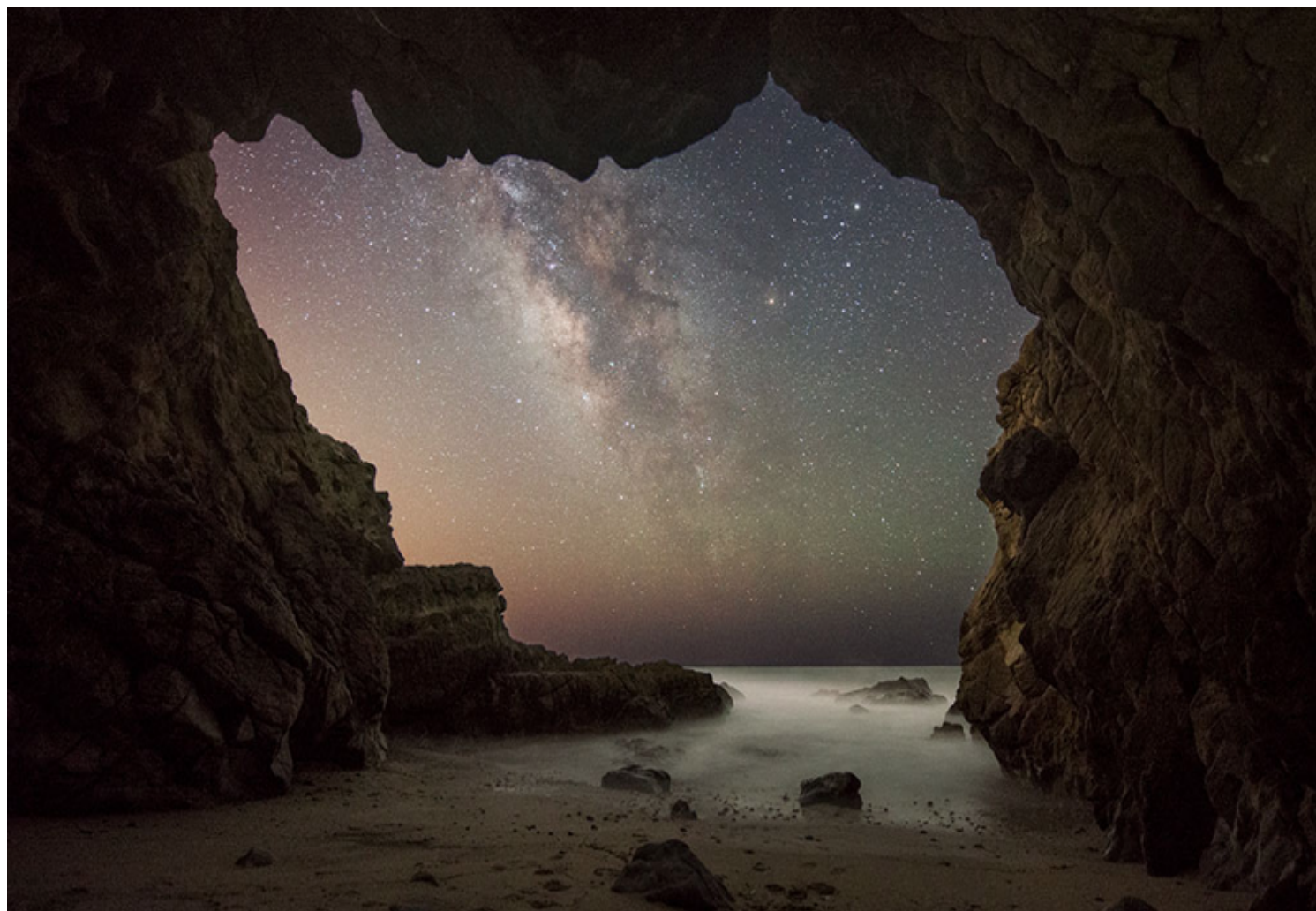
Figura 1 Vía Láctea desde la playa de Malibú, NASA ©Jack Fusco