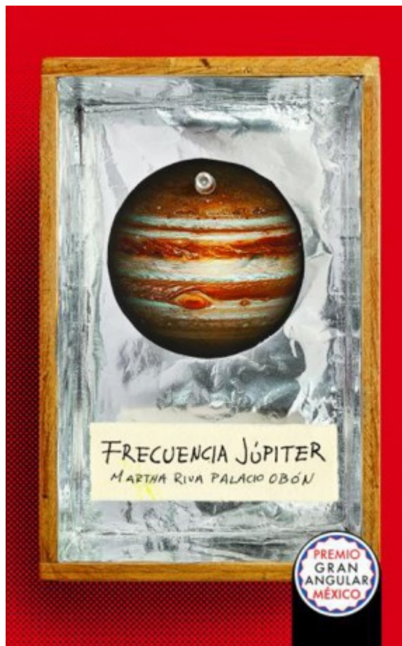
Frecuencia Júpiter, de Martha Rivalpalacio

cuestiones que no son tan significativas a nivel conceptual; es decir, podemos reconocer que algunos rasgos comunes de la literatura juvenil son la priorización del personaje joven en un proceso de aprendizaje que lo lleva a madurar, y un lenguaje aparentemente accesible para competencias léxicas intermedias; también es cierto que estos dos aspectos no son privativos de estas propuesta. Pienso, por ejemplo, en La tregua , de Benedetti y, a pesar de que el protagonista es un adulto mayor, también se enfrenta a un proceso de aprendizaje en el que habrá de madurar, y donde el autor uruguayo emplea un léxico directo y una estructura sin complicaciones.