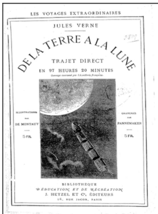
Figura 1. Portada "De la Tierra a la Luna" por J. Verne

Con todo, no parece que la Luna sea un lugar muy frecuentado, al menos por mis conocidos... ni tengo noticia de aglomeraciones; de los selenitas no encontramos rastros, salvo los que la imaginación literaria nos ha regalado. Aunque he de decir que los creadores de proyectos y las agencias espaciales ya están en marcha con la vista puesta en la creación de una base lunar permanente que se complemente con la ISS... El futuro se acerca.