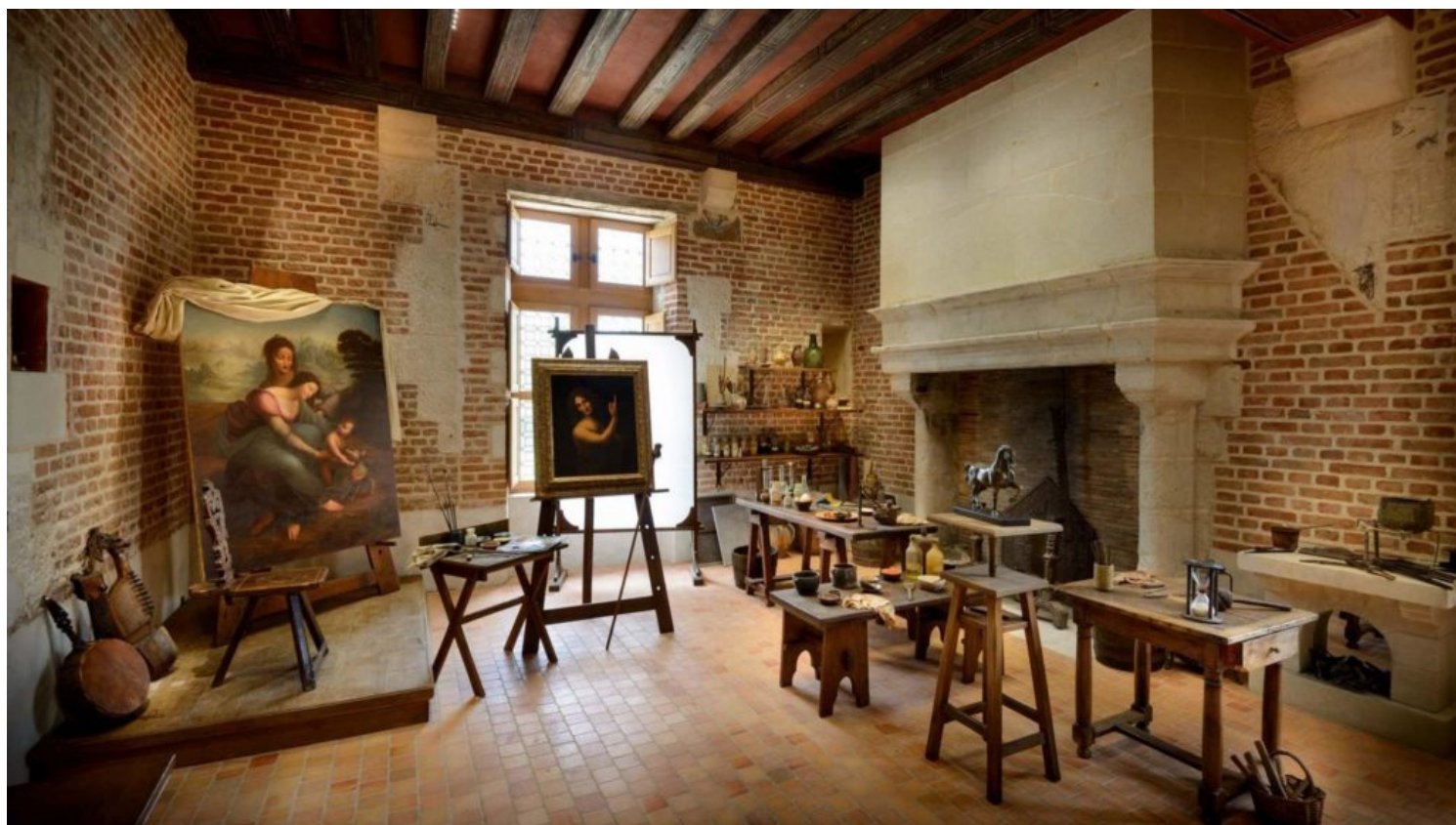
Atelier viviente de Leonardo da Vinci

Entre los castillos del Valle de Loira, donde permanece sepultado el florentino, se ha preparado una agenda de eventos culturales a lo largo de 2019, que incluye un festival de música renacentista y varias exposiciones temporales y permanentes sobre la vida y obra de Leonardo. Se exponen, por ejemplo, animaciones en tercera dimensión y varias piezas construidas en tamaño real de máquinas con sus diseños, así como un espacio dedicado a la parafernalia de los grandes banquetes renacentistas, en los cuales Leonardo ofreció una serie de propuestas técnicas y artísticas. El genio florentino viajó aún después de su muerte: en el siglo XVII, el rey Carlos II de Inglaterra (1630-1685), un amante del arte, adquirió más de 550 folios de Leonardo, que hasta la actualidad permanecen como parte de la Colección Real. Durante 2019, una selección de 144 dibujos se exhibirá en 12 museos y galerías en distintas ciudades del Reino Unido (12 obras en cada espacio, de manera simultánea); más tarde en este mismo año, se exhibirá en Londres una magna exposición de más de 200 trabajos de Leonardo, la cual luego será trasladada a Edimburgo.