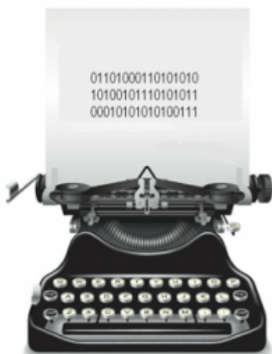
Máquina de escribir tradicional