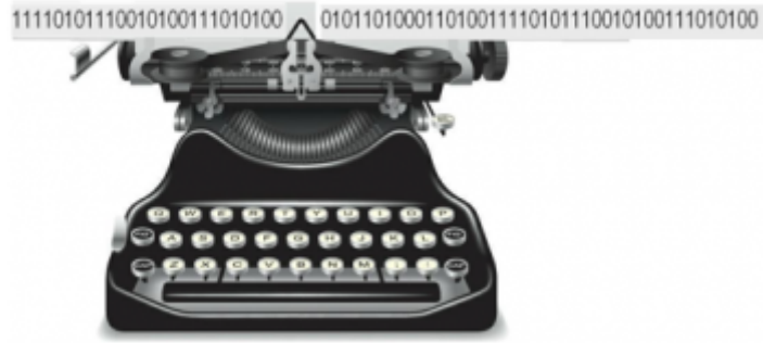
Máquina de escribir hipotética conocida como máquina de Turing