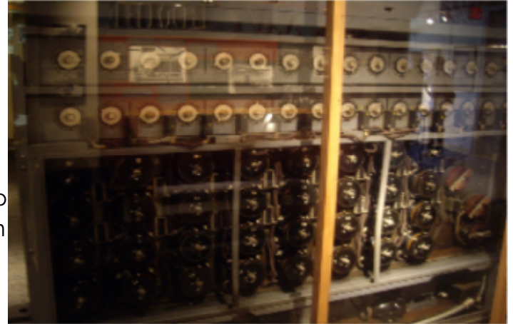
Máquina electromecánica llamada Bomb, ideada por Turing para vulnerar Enigma (exhibida en el museo nacional de Criptología de Washington D.C, EUA)

El 23 de junio de 2012 se cumplieron cien años del natalicio del científico inglés Alan Mathison Turing. Con motivo de este acontecimiento