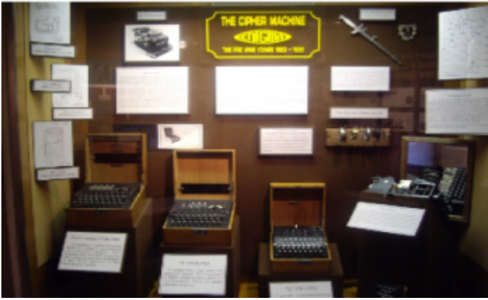
Tres máquinas de escribir Enigma (exhibidas en el museo nacional de Criptología de Washington D.C, EUA)

Como puede apreciarse en la figura, Enigma es una máquina de escribir con un juego de cinco rotores que permite crear cifrados a través de la progresiva permutación de tales rotores. Es muy curioso que una vez más el sueño infantil de Turing de jugar con máquinas de escribir se volviera realidad. Aunque en esta ocasión, la máquina de escribir Enigma representó el formidable reto criptográfico que Turing debía resolver para salvaguardar el destino de su país.