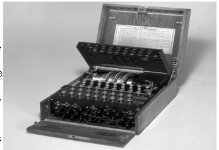
Juego de rotores de la máquina de escribir Enigma

Más de veinte años después de su muerte, documentos desclasificados del sistema de inteligencia militar inglés mostraron de manera inesperada que Turing fue el principal criptógrafo de su país durante la segunda guerra mundial. Los análisis de probabilidad de Turing y su habilidad para construir computadoras electromecánicas fueron factores claves para que un equipo especializado de cripto-analistas ingleses lograra romper la famosa máquina criptográfica alemana "Enigma", lo que permitió que los ingleses pudieran leer durante años los despachos confidenciales intercambiados por el ejército y marina alemanes. Se considera que el rompimiento de Enigma fue una de los principales razones por las cuales las fuerzas aliadas de Estados Unidos, Inglaterra y Francia lograron vencer junto con la ayuda del poderoso ejército rojo de la Unión Soviética, a la Alemania nazi de Adolf Hitler.