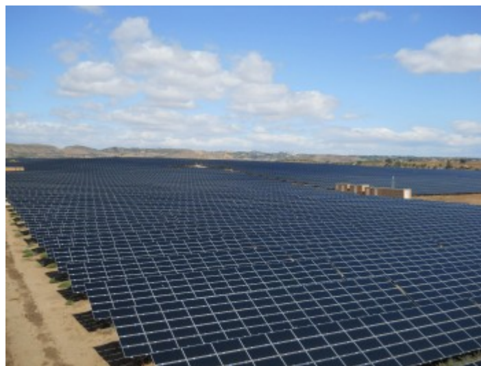
Planta termosolar en el desierto de Sonora.